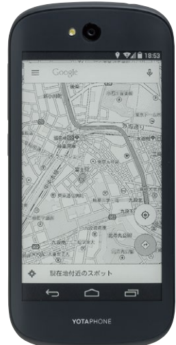
↑Googleマップは線画ふう。屋外で見やすく電池ももつ。