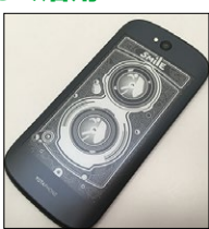
←↑撮影時、背面の絵が変わるお茶目機能(上)。メインカメラで自撮りもオーケーよ。

ント動画も再生可能)。電子ペーパーは常時表示してもバッテリー消費が少ないので、「使ったら画面オフ」というスマホの使い方革命をもたらしそうです。字数が足りないほど魅力的なYotaPhone2。ぜひ動画もご覧くださいね。(ACCN)