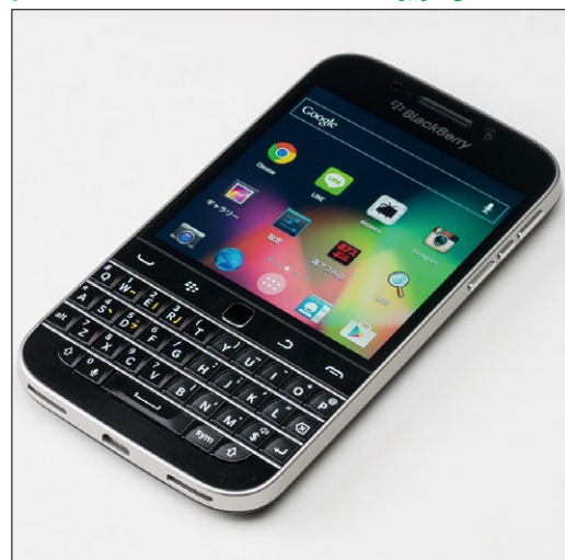
↑Androidアプリのインストール方法は週アスPLUSにて。一応、LINEやモンストも動作しましたよ。ランチャーアプリをインストールすると、ほとんどAndroidと変わらないUIで使用可能に。そのうえ日本語だってオーケーなんです。