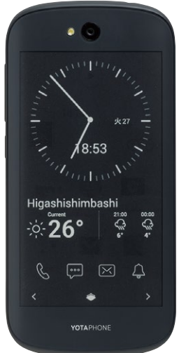
↑背面専用のメニューも用意。細かくカスタマイズできる。