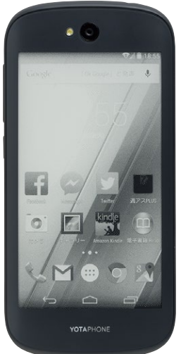
↑背面の電子ペーパーをメイン画面にすることが可能。